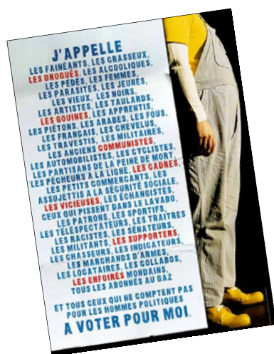
L'appel de Coluche pour la campagne présidentielle de 1981