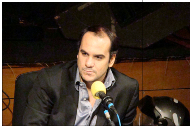
François-Xavier Demaison sur le plateau du Fou du Roi sur France Inter