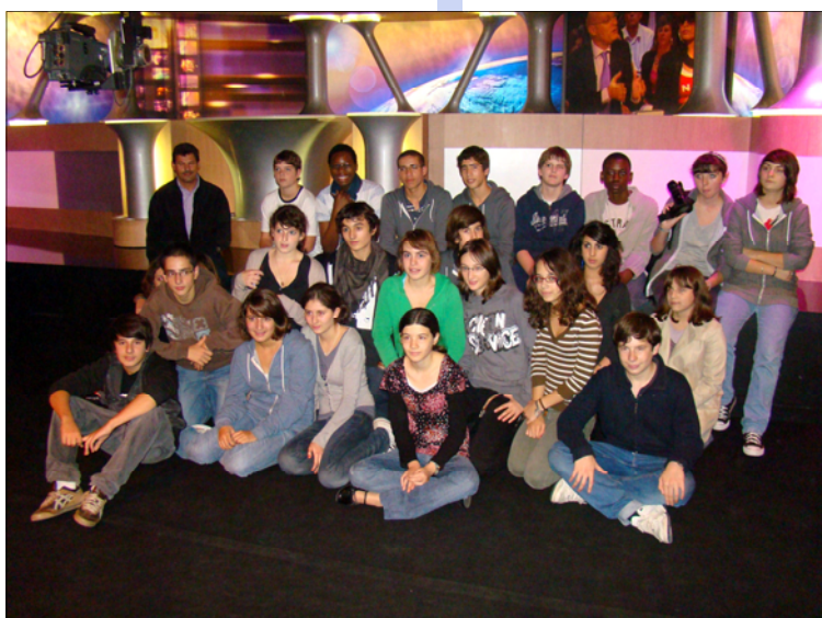
La Classe de 3 e A sur le plateau des Guignols

* Le dripping est une technique artistique qui consiste à projeter avec un outil (un pinceau par exemple) la peinture sur la toile.